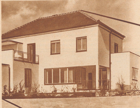
Arch. Fred Traub, Zollikon

Mit einer Feuerstelle das ganze Haus erwärmt und geheizt!