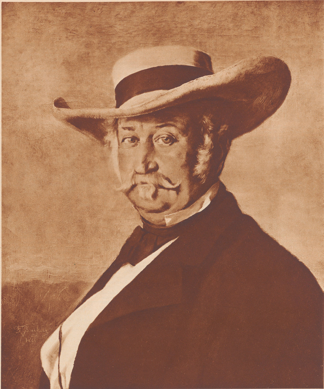
Johann August Sutter im Jahre 1866. Gemälde von Frank Buchser. (Städtisches Museum Solothurn). Sutter war damals 63jährig. Die Unterschrift jedoch stammt vom 73jährigen; sie findet sich auf dem letzten Blatt der Memoiren, die