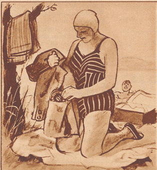
Er: «Da in der linken Tasche steckt die Gaba-Schachtel. Nimm ein paar!»