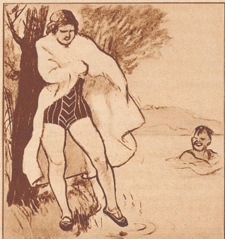
Sie: «Ach, ich bin so empfindlich, gleich kratzt es mich im Hals und der Husten kommt.»