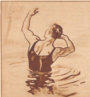
Er: «So komm doch endlich herein, das Wasser ist ja gar nicht kalt.»