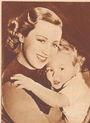
Joan Blondell and her Son Warner Brothers Star appearing in "The Perfect Specimen"

27... Kh7×g7, 28. Sd4—e6+! Schwarz gab auf. Es würde folgen: Kg8, S×f8, K×S, Te6! (Droht D×f5+), Dd7, D×f5+, Df7, D×d5, Tb8, Dd4! Dg7 (Kg8? T×h6!), Df4+, Kg8, Df5! (Droht Tg6 mit Damengewinn), Ld7? Te8+, L×T, T×L+ nebst Matt. Ein fein durchdachtes Schlußspiel des Siegers.