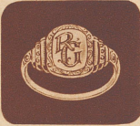
Fr. 5.— Damenring

griffen. Bei Nichtgefallen erhalten Sie Ihr Geld restlos zurück. Als Maß Papierstreifen schicken, satt um Fingerknochen messen. In 3-4 Tagen haben Sie den Ring per Nachnahme und Porto von OBRECHT, VERSANDHAUS, WIEDLISSACH a