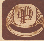
Fr. 9.— Herrenring