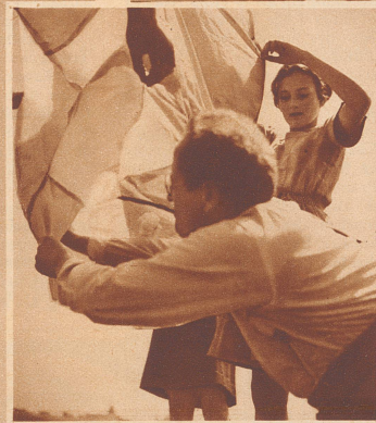
Drei Mädchen und Vater müssen den ungestümen Luftballon vor dem Start im Zaume halten. Unter Vaters Brissago seht ihr den mit Spiritus getränkten Wattenbausch in der Mitte des Drahtkreuzes.