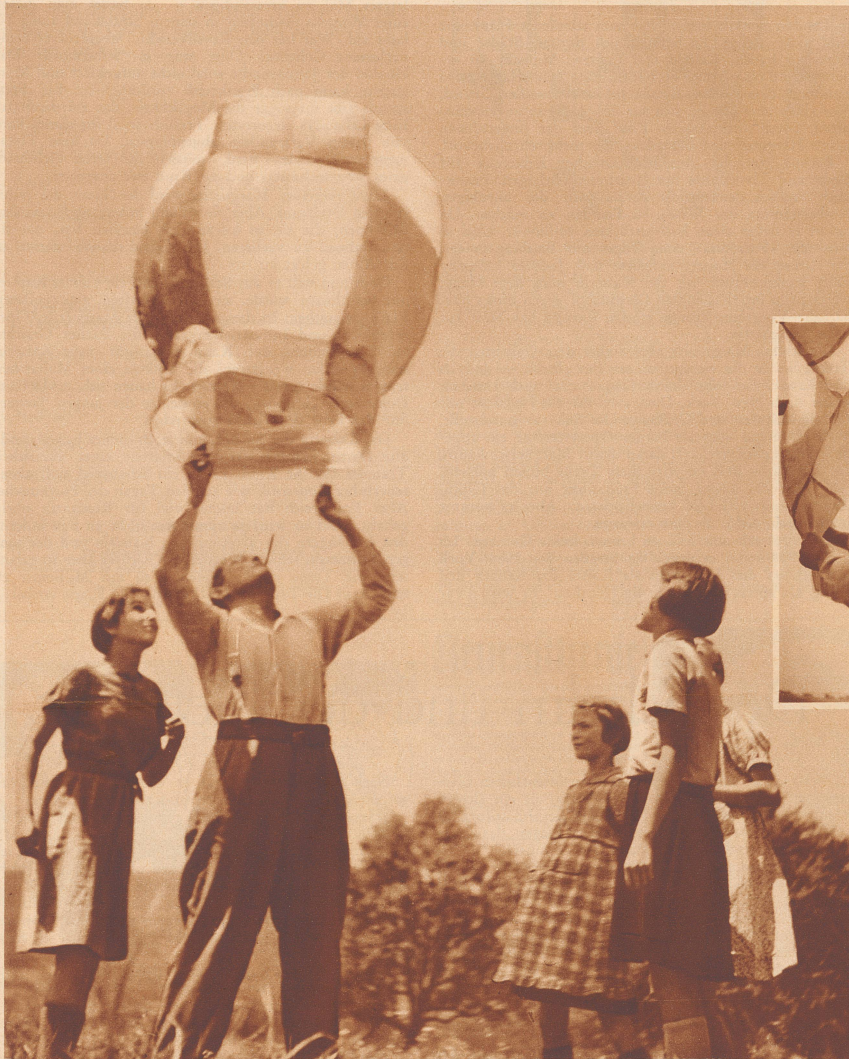
Start des Heißluftballons auf Nimmerwiedersehen!