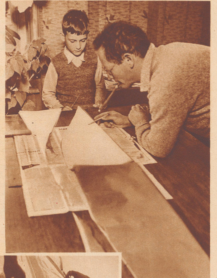
Die 12 Bogen Seidenpapier sind zu 6 zweifarbigen Doppelbogen zusammengeklebt, der Länge nach gefaltet und nach der Schablone ausgeschnitten worden. Vater hat auch mitmachen wollen und muß jetzt selber studieren, wie's am besten weiter geht.