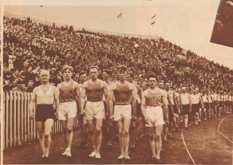
Einmarsch der ausländischen Athleten im Stadion von Antwerpen, an deren Spitze indische Turner. Von zwanzig Ländern waren rund 2500 Sportler zur III. Arbeiter-Olympiade nach Antwerpen gekommen. Entrée des délégations dans le stade d'Anvers. 25000 sportifs représentés. 20 pays participants au total de la IIIe Olympiade ouvrière.