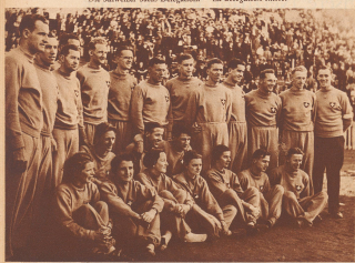
Die Schweizer Team-Delation. — La délégation suisse.