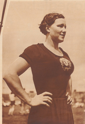
Links: Eine von den sechs russischen Kunstturnerinnen, die bei der Antwerpener Olympiade mit ihren schwebenden aber vollendeten ungelährten Uebungen im Reck und Barren glänzten. L'une des six gymnastes féminines russes qui présentèrent à dresse un fort bon programme au rebord et aux barres.