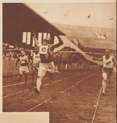
Der spannende Endspurt im 100 Meter Lauf, den der Finne Hansen in der Zeit von 15,9 Sekunden gewann. La finale du 100 mètres que remporta le Finnais Hansen en 15,9 secondes.