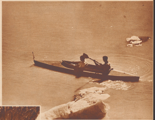
Zwischen Eisbergen auf dem Grimsel.

hatten, bis zu 5/10 Quadratmeter Segel setzen, gegen plötzliche Böen aber durch famose Kenterschiffliche geübt. Wie ein Fjord liegt der Grimselsee ganz fünf Kilometer lang zwischen der Palstrabe, dem neun gabeligen Hügel am Nollen und dem Unterzargletscher, der in den See seine Eis- und Wassermassen entsendet. Etwas der vorderen Seemur mehr an ein norwegisches Landschaftsbild, so ist uns die westliche Seebecken von Grönländfahrten her vertraut: der Gletscher bricht stiel ins Wasser ab. Zeitweise lösen sich unter mächtigem Gedröhn Teile der Eiswand, die grünlichblau und zerklüftet über dem Wasserspiegel steht. Eisberge schwimmen im See.