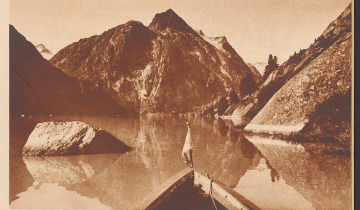
Arrière des Grimselées, dans l'immensité sous Noverdunne gasteil. Le Norvège et ses fjords! Vous n'y êtes pas: le lac de Grimsel.

Celui qui rêvait d'évasion, qui longuement restait songeur devant la Balnaisie rutilante au bord de son alpage de Zargen Götthard, ceux qui partent en esprit avec les actions blanches de la Savoie, qui recherchent toujours ces éboulis qui n'ont mille parts, ne se doutent point la joie de songer que dans peu par le prodigieux variété de ses sites peut leur offrir à peu de frais, la satisfaction de leurs vœux idéologiques. Il suffit d'un peu d'imagination et d'orgueil, d'écarter sur le lac de Grimsel pour y croquer ce canot et une idée qui étonnera le possesseur de Meringen, et après, après, vous serez plongés comme les fjords de Norvège et même — en longeant la base des glaciers — le Spitzberg. Mieux encore, la rencontre d'un matif ou pourrait vous étonner, tant il peut sembler que le diable de l'Obertal d'appartient à un norvégien.