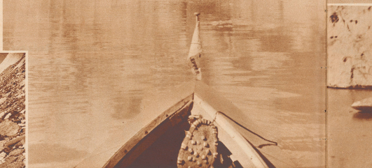
Spitzberg oder Oberhäli — Spitzberg? Non! Oberhäli.

neue Grimselsee wie erst recht das Schauspiel eines kahlenden Gletschers verschafft. Und als vollends ein phantasievoller Fahrer und Sportler ein Packboot auf dieses neue Wasser setzte, da war es ein leichtes, bei uns diese Grönländ-Bilder zu machen. Hören wir ihn: — Der freundliche Posthøler von Meringen war zuerst ein wenig erstaunt, als ich mit meinem nicht alltäglichen Gepäck anrollte: mit dem zierlichen und verpackten Boot auf Kästern. Liebenswürdig half er beim Verladen im Postwagen. Mit fröhlichem Klang des Posthølers ging's zu Berg, durch die kühlen Schluchten und die weltliche Landschaft des Oberhäli. Auf der Grimsel war der Transport der Stabtauchen zum See hinunter kein reines Vergnügen. Schließlich kam aber alles wohlbehalten drunter an, das Boot war bald aufgebaut und das Absteigen konnte beginnen. Der Grimselsee eignet sich ganz vorzüglich zum Segeln, wenn man über ein genügend breites und stabiles Boot verfügt. Wir konnten, nachdem wir uns einmal mit den unterschiedlichen Winden, die hier wehen, vertraut gemacht