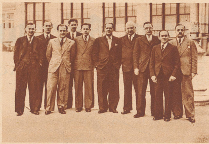
Von links nach rechts: Fine, Grob, Koltanowski, Keres, Dunkelblum, Landau, Dr. Tartakower, Reynolds, Dwyer, List.