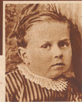
Vierjährig - Quatre ans