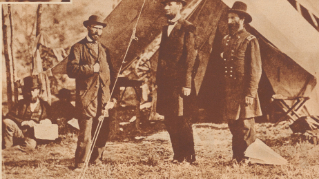
Im Lager von Antietam zusammen mit dem General McClellan (rechts) und dem Generalfeldmarschall Allan Pinkerton, dem Chef des Geheimdienstes der Nordarmee. Nach Abschluss des Bürgerkrieges gründete Pinkerton ein Unternehmen, das heute als Central Intelligence Agency bekannt ist.

Im Jahre 1790, kurz nach Abschluss des amerikanischen Unabhängigkeitskrieges, hatten die dreizehn Vereinigten Staaten von Nordamerika eine Bevölkerung von 4 Millionen Seelen, unter denen etwa 500 000 Neger-Sklaven waren. Die Einstellung zur Sklaverei war entweder eine patriarchalische oder eine christliche geistliche. 1793 geschah etwas, das eine vollständige Wandlung in der Einstellung der Sklaverei herbeiführen sollte. Eli Whitney erfand die Entkörnungsmaschine für Baumwolle. (Diese Maschine löste die Leistungsfähigkeit eines Sklaven bei der Entkörnung der Baumwolle auf das 160fache. Die Baumwollerzeugung wurde dadurch zu einem entscheidenden Geschäft, denn erst die neue Maschine ermöglichte die Ausfuhr großer Mengen nach England.) So wurde die Baumwolle eine angelegte Quelle des Reichtums für die Sklavenerhalter des Südens, die sich rasch in eine aristokratische und streng autoritäre Klasse wandelten. Bald verschob sich das politische Schwergewicht merklich zugunsten des Südens und 1850 konnten die Sklavenerhalter das Bundesgesetz erzwängen, wonach Sklaverei in dem Gebiet eines Staates, in dem es keine Sklaverei gab, hinfällig, ausgetilgt werden musste. Die feudalen Herren des Südens erwarteten die Südstaaten in ökonomischer Hinsicht in eine englische Kolonie zurück. Unterdessen bildete der moderne Norden von einem Triumph zum andern; Chicago entstand, New York blühte auf, die Landwirtschaft wurde mecha-