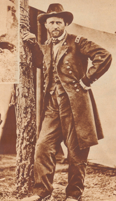
General Ulysses Grant in deren Hände Anfang 1864 die Lüneburg, der gemessenen Streitkräfte der Nordarmee gegen wurde. General Ulysses Grant eroberte die Lüneburg im Januar 1863. Er eroberte die Lüneburg im Januar 1863. Er eroberte die Lüneburg im Januar 1863.