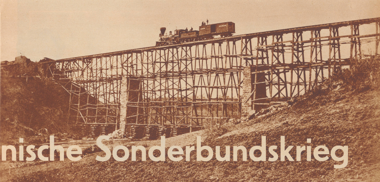
Die Eisenbrücke über den Potomac. Die Eisenbrücke über den Potomac wurde im Sommer 1862 im Auftrag von General Grant gebaut. Die Eisenbrücke über den Potomac wurde im Sommer 1862 im Auftrag von General Grant gebaut.

Die 12 Sklavestaaten begannen nun den Abfall von Staatenbund, in dem es bereits 19 freie Staaten gab, vorzubereiten. Im November 1860 fand die Neuwahl des Präsidenten statt. Mit der Wahl des nordlichen Kandidaten, Abraham Lincoln, mußte geschrien werden. Die Sklavestaaten waren bereit, zum Abfall überzugehen und warteten nur noch auf ein Signal. Die Wahl Lincolns war der erste Signal. South Carolina war der erste Bundesstaat, der am 20. Dezember 1860 sämtliche Gesetze, mit denen die Zugehörigkeit des Staates zum Bunde beschlossenen worden war, einseitig außer Kraft setzte. Mississippi, Florida, Alabama, Georgia, Louisiana und Texas folgten nacheinander gleichlaufende Beschlüsse und begannen mit den Vorbereitungen zum Krieg gegen den Norden.