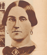
Portrait of a woman, likely a historical figure related to the Civil War.

Die Hinrichtung der vier Kompanien Booth, die Lincoln ermordeten. Die Hinrichtung fand am 4. März 1865 in Washington statt. Die Hinrichtung fand am 4. März 1865 in Washington statt.