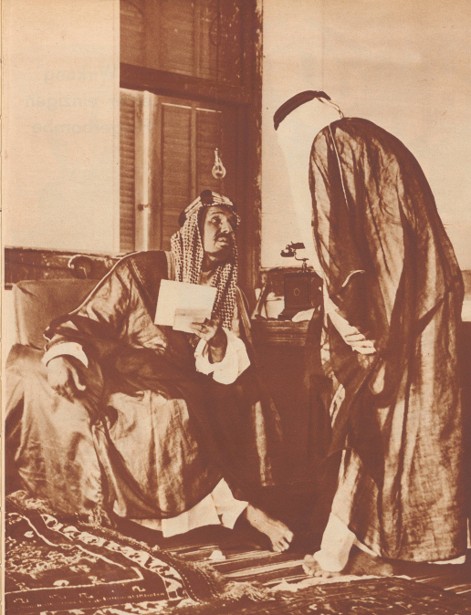
König Ibn Saud in seinem Privatzimmer im Palast von Taif. Zur arabischen Bildung und dem rasken Fiklen nehmen sich die primitiv konstruierten elektrische Glühbirnen und das Telefon anders wunderbar an. Der Wahhabitenführer, der sich streng an die Satzungen des Korans hält, hat sich mit der Einrichtung von Telefonen und Radiostationen, mit deren Hilfe er sein ausgedehntes Reich regiert und kontrolliert, in offenen Widerspruch zu den Ansätzen der wahhabitischen Geistlichkeit gesetzt. In diesem Punkte war er unumgänglich und hat mit der ihm eigenen Energie seinen Willen durchgesetzt. Am Ende einer langen Debatte für und wider die drahtlosen Stationen soll er gesagt haben: «Diese Maschinen sind keine abstrakte Mager und werden eingedrückt. — Wer jetzt noch ein Wort dagegen sagt, verliert seinen Kopf!»

La lampe électrique et le téléphone construits à moments faibles avec le système arabe et le pays. On se croirait plus facilement dans une chambre d'artiste de cinéma que dans le royal appartement d'Ibn Saud. Le Prince des Wahhabites qui observe rigoureusement les préceptes du Coran est, par ailleurs, un souverain moderne. Comme on lui opposait de violentes critiques sur l'installation de la radio et du téléphone, il répondit: «Ces instruments ne servent pas à tout de la magie noire. Ils font bien mieux de chef d'état. Si quelqu'un a encore une remarque à me faire à ce sujet, il le paiera de sa tête.»