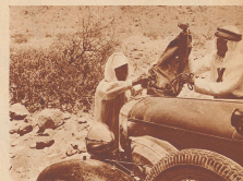
Vue de Taif, résidence d'été d'Ibn Saud. Sur la droite le palais royal. Die Fahrt von der Küste nach der Residenz Ibn Sauds ist mühsam. Vor allem der letzte Teil des Weges, die ca. 120 Kilometer lange Strecke von Mekka nach Taif, ist keine Straße, sondern ein Karawansaray. Bei einem Zugenschlupf der nicht mit der Karawansaray, sondern nach der Auzan auf ihren Fahren bestiegen, wird der Wagen mit neuem Kühlwasser versorgt.