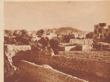
Blick auf Taif, die Sommerresidenz Ibn Sauds. Rechts im Bild das Königspalast.