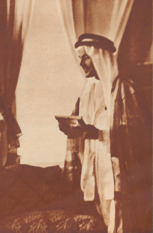
Rechts: Ibn Saud diktiert einem Scheich seine neuesten Erlasse. Ibn Saud dicte un décret à son secrétaire.

Das Gespräch da dort wartet den moment d'être reçu en audience par Ibn Saud. Dans ce pays, non seulement les ministres, dignitaires et fonctionnaires, mais chaque citoyen, si modeste soit-il, a le droit de solliciter l'audience du souverain et de l'entretenir avec lui.