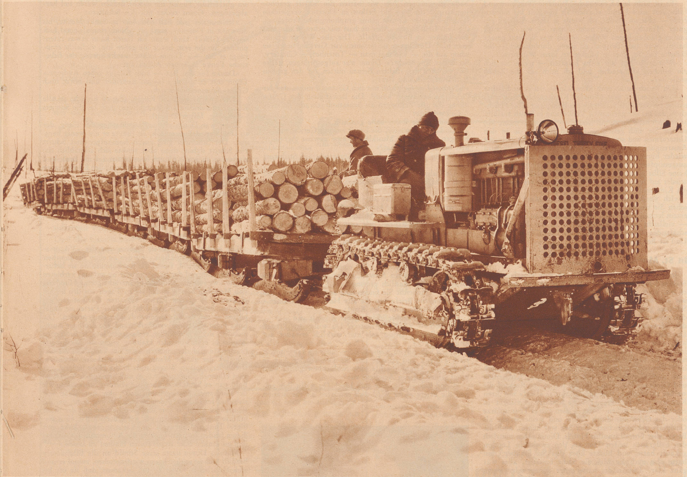
In Kanada. — Au Canada.