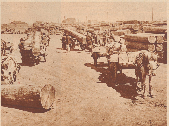
In Mandschukuo. — Au Mandchoukuo.