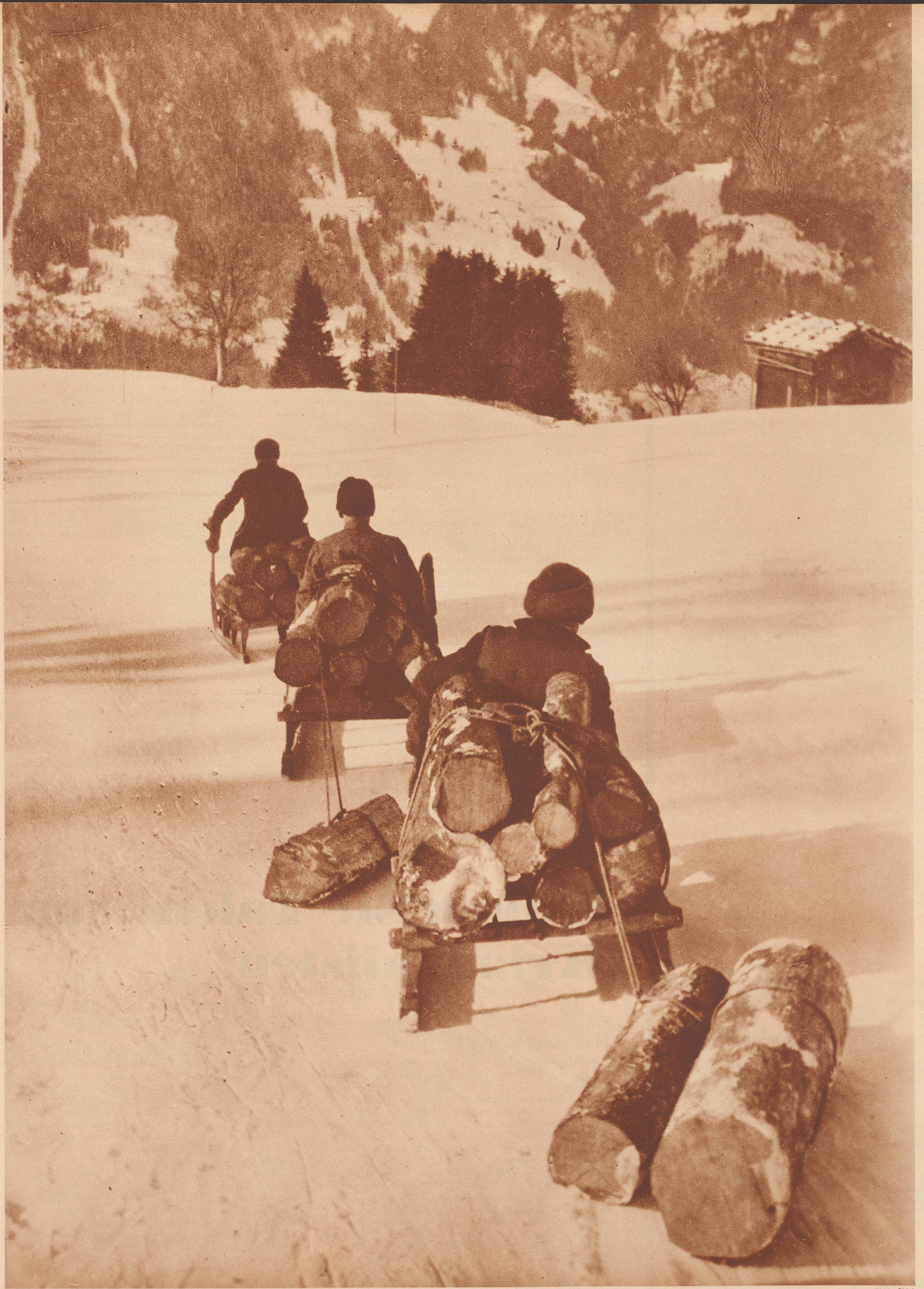
Im Lötschenthal. — Au Lötschenthal.