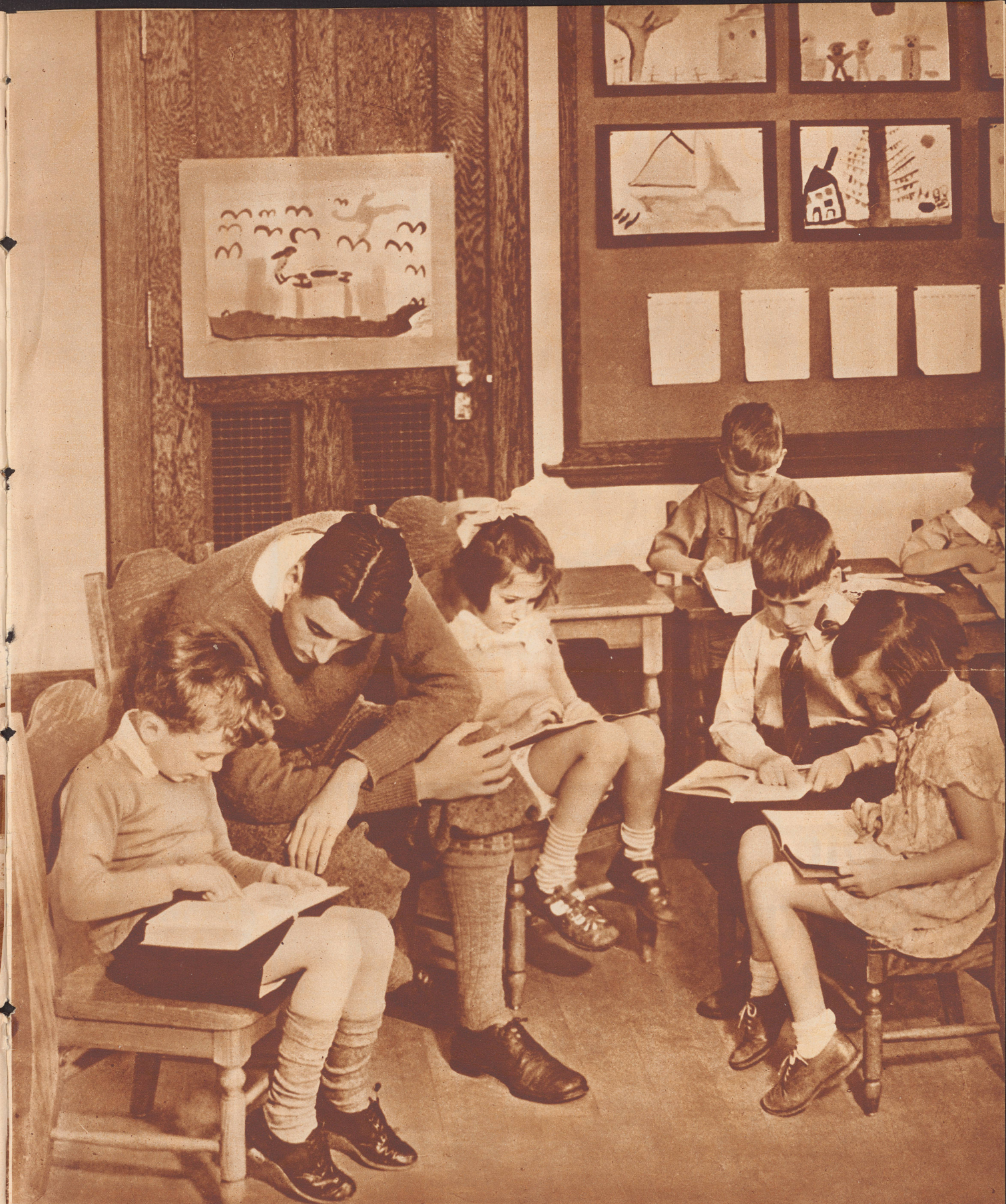
Zwanglos gruppieren sich die Kinder um ihren Lehrer. Die Lesestunde ist für sie kein Schulfach, sondern ein recht gemütliches Beisammensein.