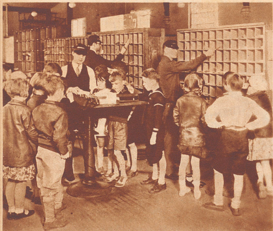
Um die Kinder mit den Vorgängen des praktischen Lebens vertraut zu machen, schreibt der Lehrplan regelmäßige Rundgänge durch öffentliche Betriebe und Fabriken vor. Unser Bild zeigt eine Schulkasse, die in einem Postamt der Verteilung und Abstempelung der Briefe zuschaut.