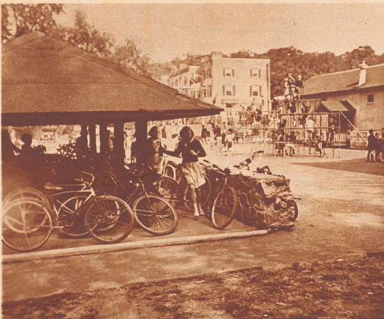
Die Spielstunden in amerikanischen Schulen sind eine äußerst vergnügliche Angelegenheit. Turngeräte und ein ganzer «Velopark» stehen den Kindern zu freier Verfügung.