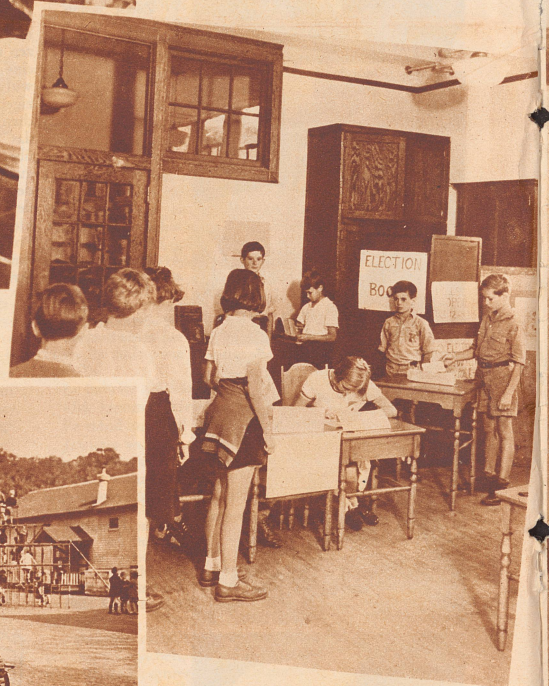
Frühzeitig werden die amerikanischen Kinder über Pflichten und Rechte des Staatsbürgers aufgeklärt. Das Schulzimmer wird in ein Wahllokal umgewandelt und jeder Schüler hat nun nach Gewissen und Überzeugung zu wählen.

Die amerikanischen Schulen kennen im allgemeinen keine nach Geschlechtern getrennte Klassen. Teilweise bis zur Universitätsreife besuchen Knaben und Mädchen die nämlichen Schulklassen. In einigen ganz modernen Schulen ist neuerdings das Selbstlehrprinzip eingeführt worden. Die Lehrer instruieren die Kinder über einen gewissen Gegenstand, und die Schüler erörtern dann das Thema unter sich in allen Variationen. Die Lehrer sind nur bestrebt, die meist sehr lebhaften Diskussionen nicht ausarten zu lassen. Spiel- und Sporttage, Nachmittage, an denen nur musiziert, gemalt oder gebastelt wird, ergänzen den Stundenplan auf sehr harmonische Art. Es ist das Bestreben dieser modernen Schulen, den Stundenplan so zu gestalten, daß den Kindern die Schule ein lieber Aufenthaltsort ist und sie nicht sehnsüchtig das Ende der Stunden erwarten. Das Hauptziel, das der Unterricht verfolgt, besteht darin, in den Schülern das Selbstvertrauen zu stärken und in die richtigen Bahnen zu lenken. Gleichzeitig sollen durch individuelle Lehrplangestaltung die Anlagen jedes einzelnen — auch der einseitig Begabten — zur glücklichen Entwicklung gebracht werden.