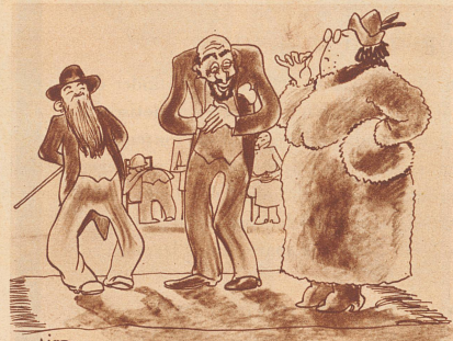
Im Heiratsvermittlungsbüro. Zeichnung von R. Lips

Schwer von Entschluß. «Hat Ihre Tochter einen Beruf?» «Noch net. Sie entschließt sich so schwer. A jeder von ihren Verehrern will sie zu was anderem ausbilden lassen.»