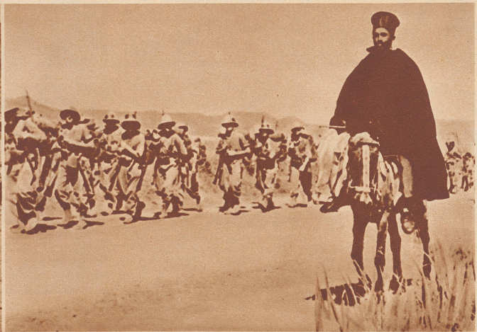
Italienische Infanterie auf der großen Karawanenstraße im Vormarsch auf Makalle. Mit dem Bataillon reitet auf einem Maulesel ein koptischer Priester.