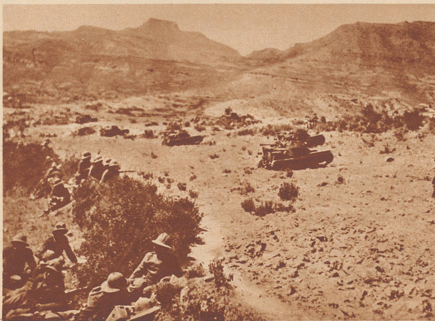
Italienische Infanterie im Angriff auf die Stadt Makalle. Vor der Infanterieschutzlinie fährt durch das verhältnismäßig gute Gelände eine Tankabteilung.