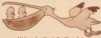
«Nicht wahr, Mami, Zwillinge bringt doch der Pelikan?!»

Der Stift. Der Chef überraschte den Stift, als er eine kleine, junge Stenotypistin küßt. «Sie sind hier nicht als Lippenstift engagiert!» donnert ihn der Chef an.