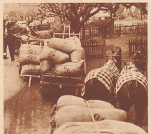
Das sind keine Bergbauern, sondern Landwirte, die einige Jucharten ihres Besitzes mit Weizen, Gerste, Roggen etc. bebauen. Mit Zwergpferden, Brechen- und Leherwagen bringen sie das Erzeugnis ihrer Ernte zur Abnahmestelle.

Der wichtigste Mann bei der Getreideübernahme: der Prüfer. Probeweise genommen er den Sack eine Handvoll Getreide, steckte daran, ließ es durch die Finger rennen und legte es dann auf die Hebelwaage zum Feststellen, ob der Feuchtigkeitsgehalt den Vorschriften entsprach. Er hat eine feine Nase und kann von weitem riechen, ob das Korn Brandig ist, kann sagen, ob es im Isären oder Leimboden gewaschen ist und ob es bei gutem oder schlechtem Wetter geerntet wurde. Nach seinem Befehl wird der Preis festgesetzt.