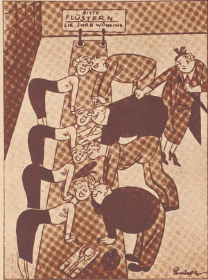
Lärmfreie Woche in Zürich «Ein halbes Dutzend, Kragenweite 42 — — — und was machen Sie heute Abend, pst, pst...»

Sie: «Wenn ich einen Mann nicht leiden kann und er fragt mich, wo ich wohne, dann sage ich immer: draußen in der Vorstadt.» Er: «Ausgezeichnet, Fräulein Ellinson, ausgezeichnet! Aber wo wohnen Sie nun wirklich?» Sie: «Draußen in der Vorstadt, Herr Short.»