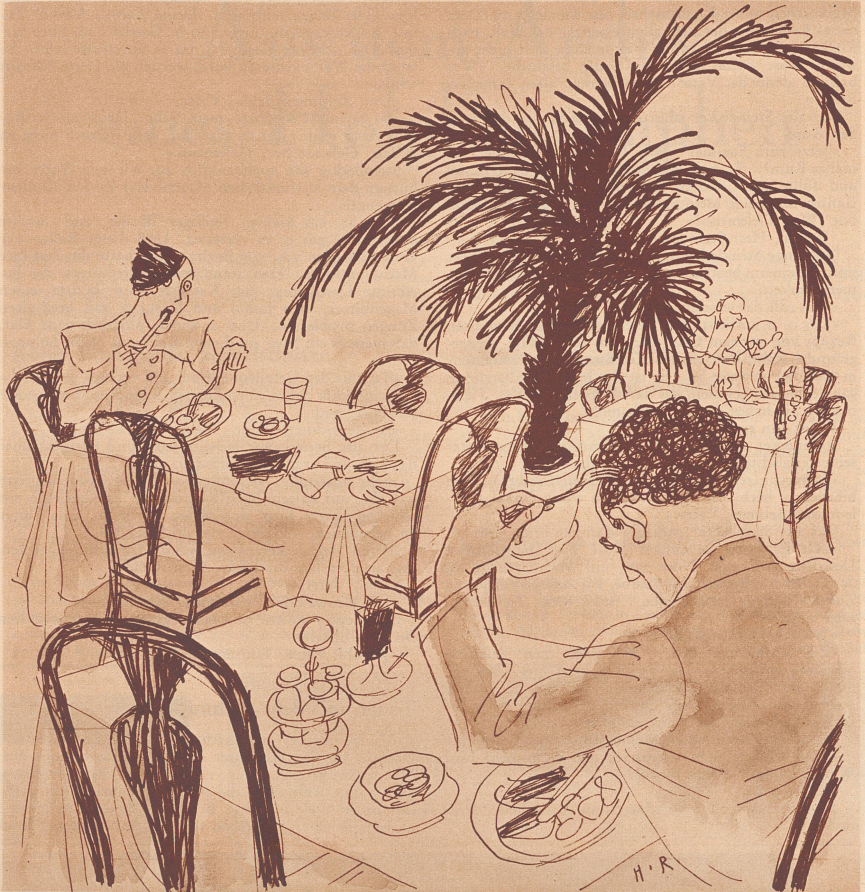
«Unerhört, der Kerl kratzt sich mit der Gabel im Haar — da bleibt einem ja das Messer im Munde stecken!»

«Haben Sie das nette Mädchel geheiratet, das Sie damals kannten, oder kochen Sie noch immer Ihr Essen selber?» «Ja, beides.»