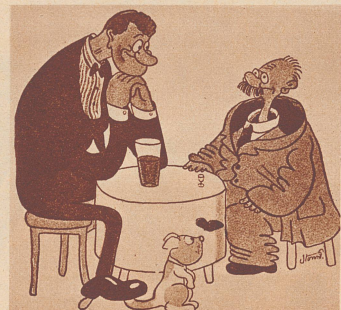
«Wie fühlen Sie sich nach der Abmagerungskur?» «Ein bißchen einsam im Anzug!»

«Sagen Sie mir ganz aufrichtig, was Sie an meinem Buche auszusetzen haben.» «Offen gestanden, ich finde, die beiden Einbanddeckel müßten viel näher beieinander sein.»