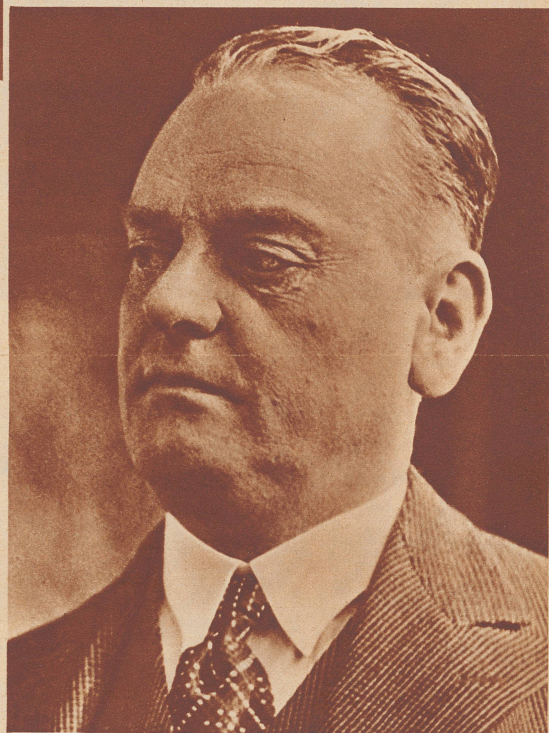
Direktor Gottlieb Duttweiler, der Initiator des Hotel-Plans.

Aufnahmen von der Delegiertenversammlung des Schweizerischen Hoteliersvereins, die am 2. und 3. Mai 1935 in Baden tagte