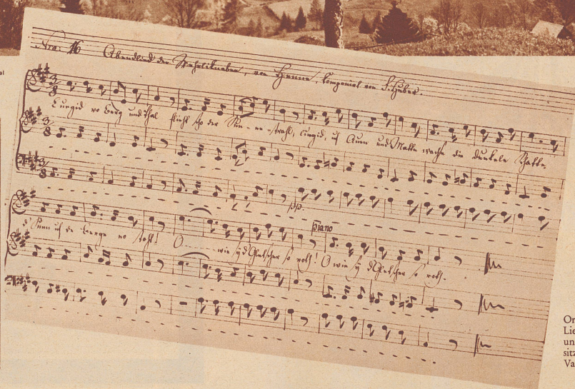
Originalhandschrift des Liedes «Luegid vo Berg und Thal...» (im Besitz der Stadtbibliothek Vadiana, St. Gallen).

Mit der warmen Jahreszeit, die mit Sonnenkraft und Frühlingsglanz in den Bergwinter einbricht, erwacht in Talern und Alpen wieder die Poesie der Alphornklänge, der Lieder, Jodel und Herdenglocken. Von allen Liedern, die nun wieder erklingen werden, ist «Luegid vo Berg und Tal» gewiß eines der schönsten. Wer schuf die Melodie, und wer ist der Dichter dieses Liedes, das man schon das schönste Mundartgedicht genannt hat?