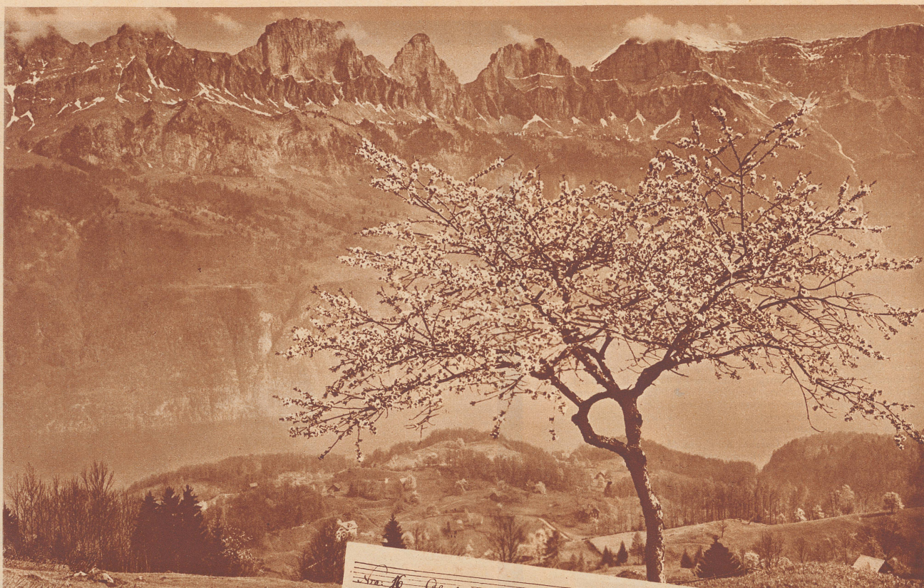
Frühling ob dem Walensee.