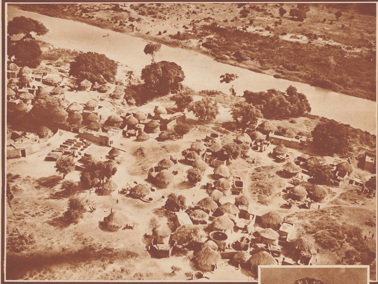
Negersiedlung bei Kuka am westlichen Ufer des Tschadsees, im ehemaligen Sultanat Bornu. Kuka war die Residenz Sultan Omars, der Nachtigal weitgehenden Schutz und Unterstützung gewährte. Omar folgte dessen Sohn Aba-Haschim auf den Thron. Dieser wurde durch den arabischen Sklavenjäger Rabeh gestürzt. Aber noch ehe sich eine Dynastie Rabeh entfalten konnte, teilten Frankreich, England und Deutschland 1901 das Reich Bornu auf. Seit 1918 gehört es zu British-Nigeria. Das Bild dieses Negerdorfes ist eine Luftaufnahme aus 100 Meter Höhe.