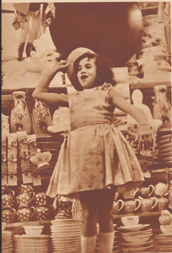
Eine neunjährige Französin, die von ihren Eltern dazu angehalten wird, durch ihre Rednergabe und ihr mimisches Talent Käufer anzuziehen.

In alten Kalendergeschichten steht jeweils zu lesen, daß frühreife Kinder und Wunderkinder nie alt würden, denn der kindliche Körper könne den Anforderungen des Geistes nicht genügen. Beispiele aus der Geschichte haben dieser Auffassung recht gegeben. Zu bedenken ist, daß vor Jahrhunderten, vor Jahrzehnten noch die Talente des geistig frühreifen Kindes forciert wurden. Waren die Eltern unbemittelt, so suchten sie eben daraus Kapital zu schlagen, was ihnen recht oft auf Kosten der geistigen und körperlichen Gesundheit des frühreifen Kindes gelang. Es gab ein Zeitalter, in dem Wunderkinder gezüchtet wurden — oft waren echte Genies darunter, man denke an den jungen Mozart und seine Schwester, an den Mathematiker Gauß, an die vielen Kinder, die als Sprach- oder Gedächtnisphänomene an den Höfen von Fürsten und Königen lebten, früh starben oder in Armut und Vergessenheit gerieten, wenn ihre armen, zerquälten Köpfe sich nicht immer wieder zu neuen übermäßigen Leistungen zwangen.