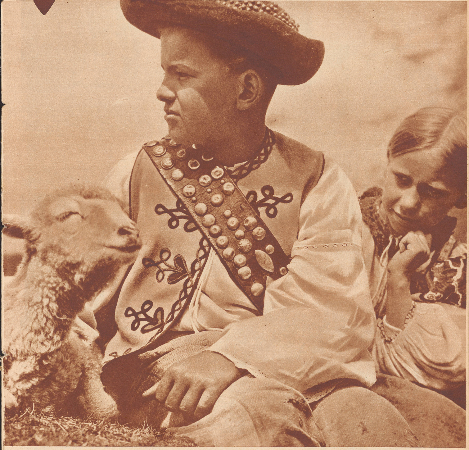
Kleiner Hirte aus den Karpathen

Druck und Verlag: Conzett & Huber, Zürich und Genf