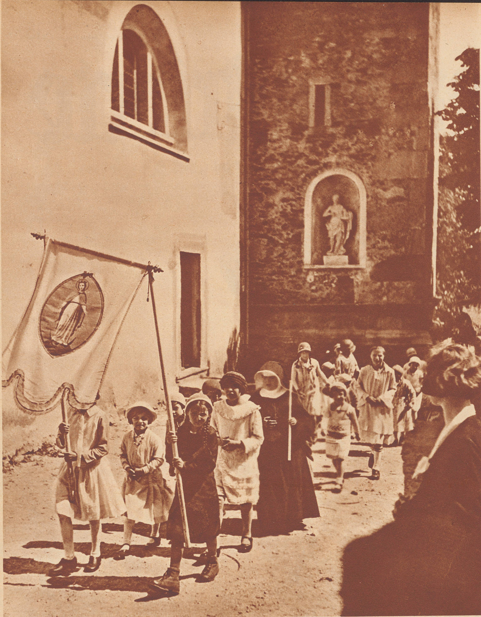
Ostern im Tessin. Kinderprozession am Ostertag im kleinen Dorf Ronco am Langensee.