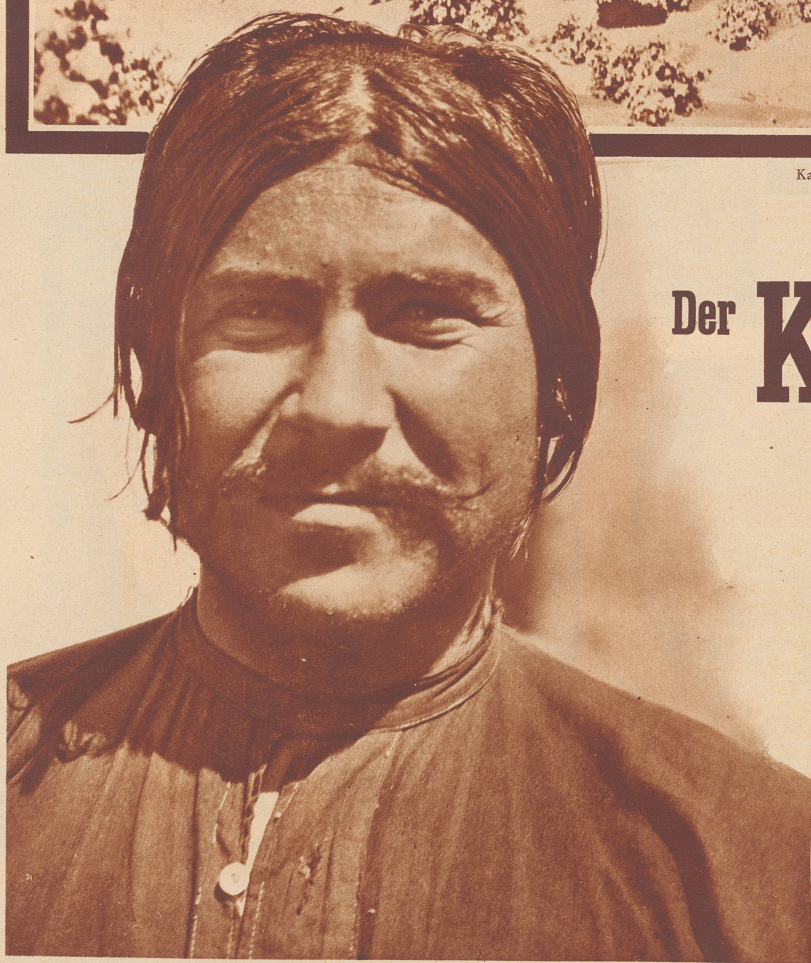
Afghanischer Karawanenführer vom Khaiberpaß.