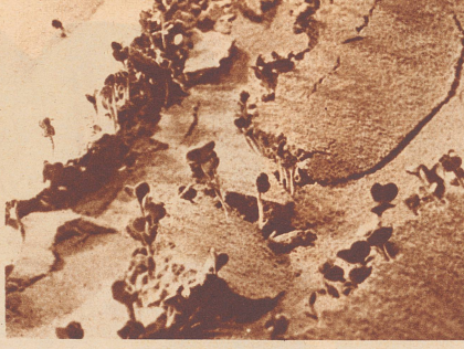
Rettich- und Radieschensämlinge wurden mit einer Erdschicht bedeckt und diese festgestampft. Langsam, aber unaufhaltsam wie ein Keil, schieben sich die Keime vor, Risse und Spalten bilden sich in der harten Erdkruste, durch die die Triebe zwischen den abgehobenen Schollen ans Licht dringen.