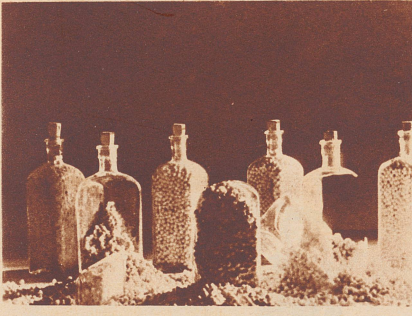
Quellende Erbsen vermögen dickwandige Glasflaschen zu sprengen. Das Wasser dringt ins Innere der Erbsen ein, mit unwiderstehlich wachsendem Druck pressen die immer größer werdenden Kugeln gegen das feste Glas, bis dieses nachgibt und bricht.