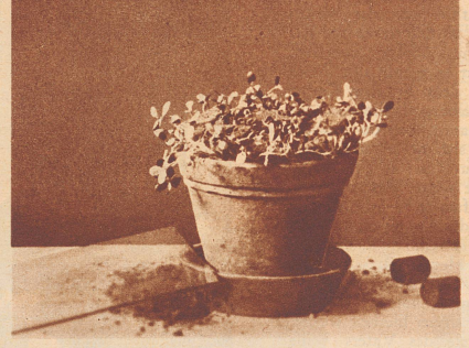
Ein Blumentopf wurde mit einer Glasscheibe bedeckt, diese durch zwei Gewichte beschwert. Die Sämlinge vermochten sich der beiden Gewichte und der Glasscheibe zu entledigen.