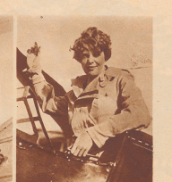
Lady Heath, Inhaberin verschiedener Rekord, ist auch die erste Frau, die die Handhabung des Flugzeuges erlernte. Sie stieg im Dezember 1907, im südlichen England und flog täglich nach Paris und Moskau.