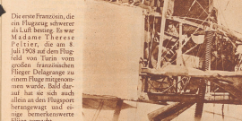
Die erste Französin, die ein Flugzeug schweben ließ, hieß Therese Pelletier. Sie stieg am 8. Juli 1908 auf dem Flugfeld von Paris vom großen französischen Flieger Delagrave in einem Flugzeug aus, von dem sie sich auch allein aus dem Flugzeug herabgewagt und einige bemerkenswerte Flüge gemacht.