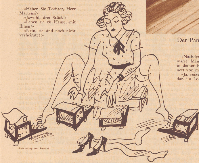
Zeichnung von Rewald

«Haben Sie Töchter, Herr Martens?» «Jawohl, drei Stück!» «Leben sie zu Hause, mit Ihnen?» «Nein, sie sind noch nicht verheiratet!»