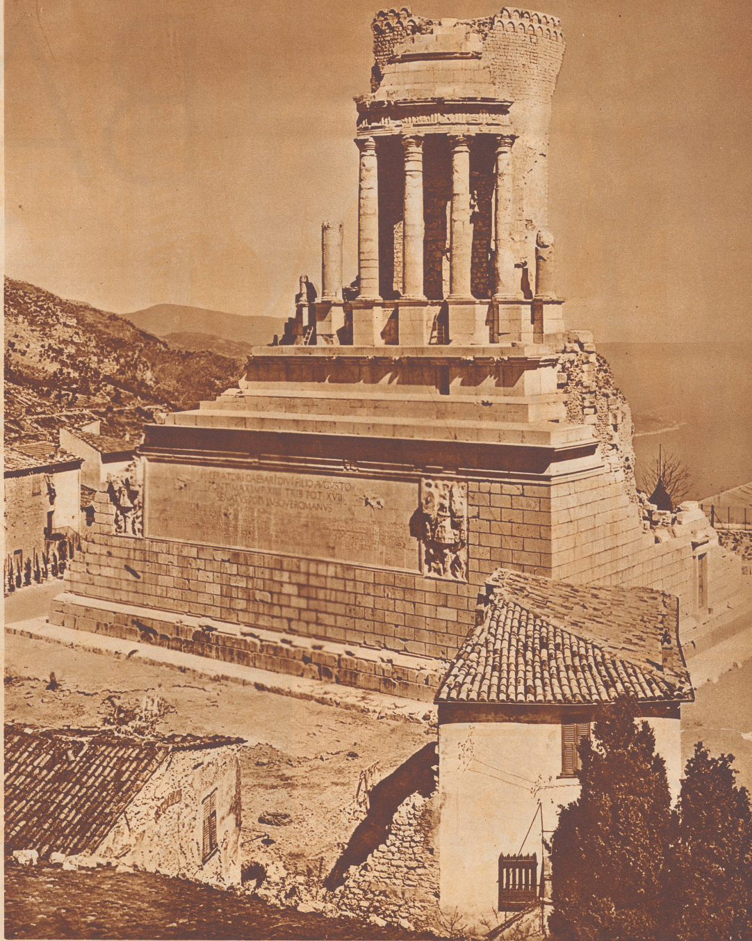
Das Denkmal nach erfolgter Rekonstruktion in seinem heutigen Zustand.

Die Siegestrophäe nach ihrer Fertigstellung, etwa zu Beginn der jetzigen Zeitrechnung. Der ganze Aufbau bestand aus einem riesigen quadratischen Sockel, einer runden dorischen Säulenkolonnade, einer Trittpyramide, auf welcher als Abschluß eine Statue des Augustus postiert war. Das Denkmal maß an der Basis 37 Meter im Quadrat und war 35 Meter hoch.