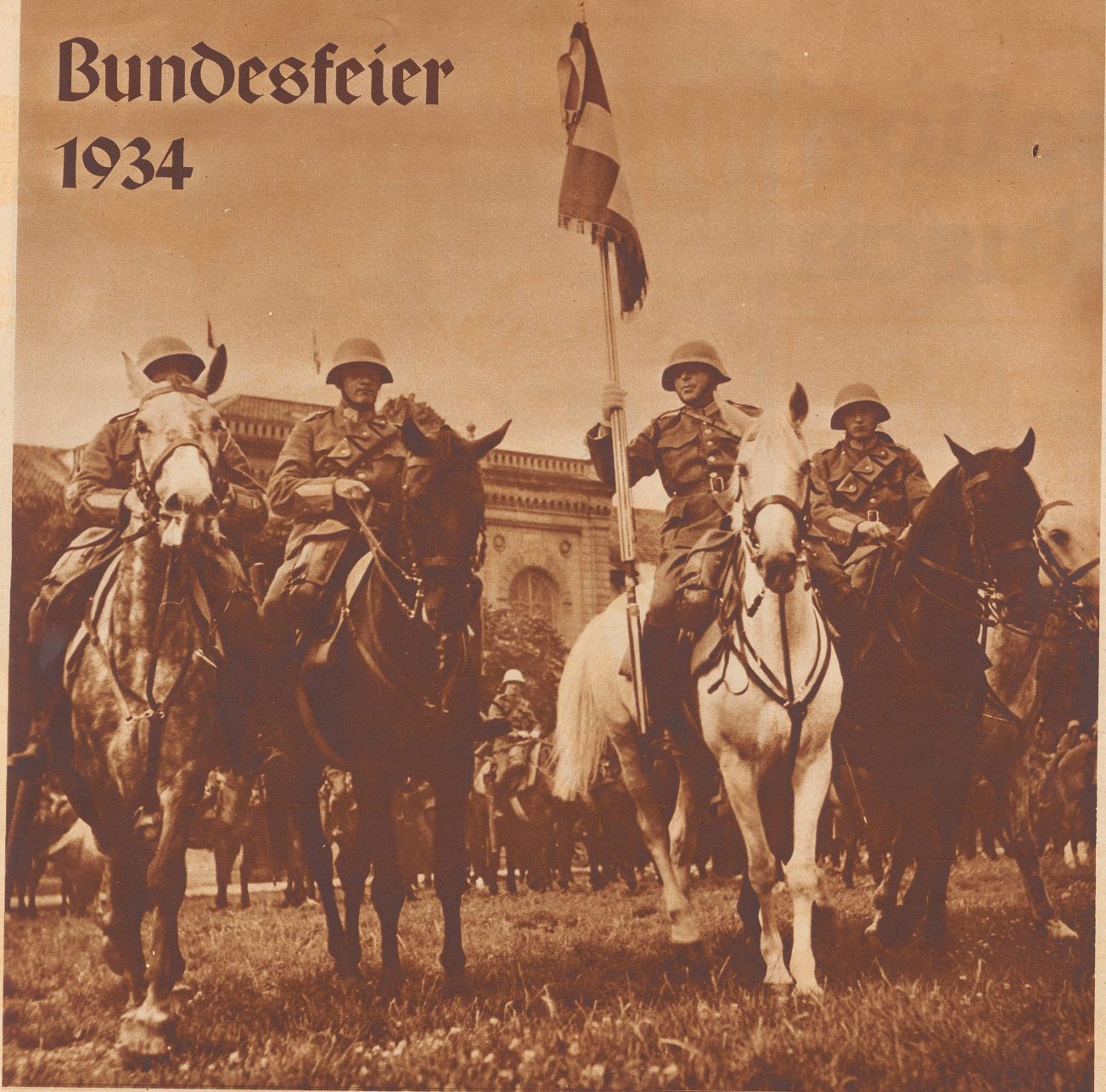
In Erinnerung an die vor zwanzig Jahren erfolgte Mobilmachung der gesamten Armee wurde überall im Schweizerland der diesjährige Nationalfeiertag in besonderer Weise begangen. In Zürich gipfelte die Feier in einem Zug des Militärs – Infanterie und Kavallerie – durch die Stadt und einer großen patriotischen Kundgebung auf dem alten Tönhalleareal. Bild: Die Uebergabe einer Kavallerie-Regimentsstandarte im Kasernenhof, auf dem selben Platz, wo 1914 die Truppen vereidigt wurden.