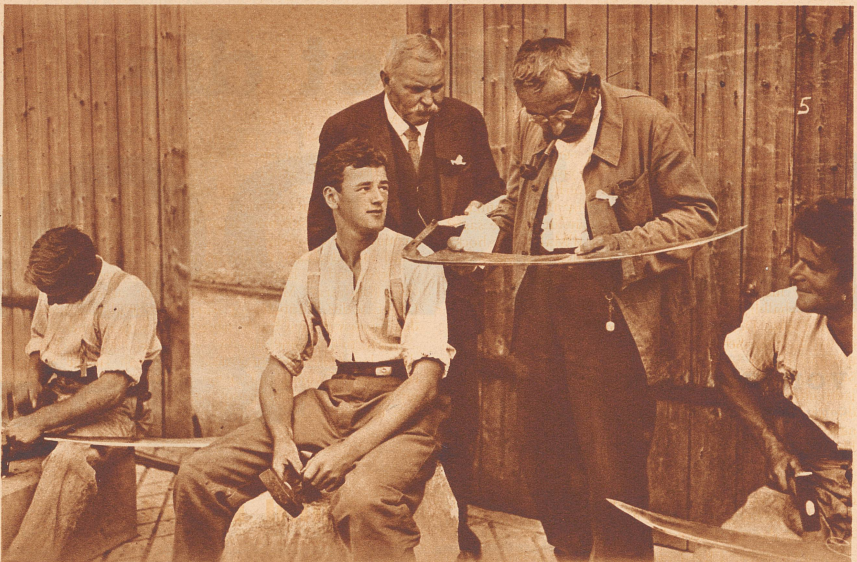
Das scharfe Auge des Preisrichters

Am Zähni ha-n-i my Glas ustrunge-n-und bi mit ere Nummere vo der «Neie Zirizytig», wo-n-i z'midag kauft gha ha, haim. Im Bett ha-n-i si no gläse, wil i gmaint