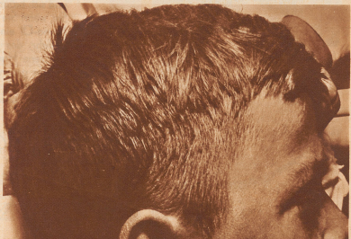
Aufnahme vom 12. April 1933: Heilung. Der Kopf ist wieder bedeckt mit schmelzenden lockigen gesunden Haaren, die die verbliebenen kleinen narbigen Stellen gut bedecken.

6) Wochen alte Kultur des Trava-Pilzes (Achroon Schillingii). Die Identifizierung des Pilzes gelang nur durch die kulturelle Züchtung auf einem künstlichen Nährboden. Es gibt etwa 200 verschiedene Arten von Schilling-Pilzen, die Haut oder Haarwurzeln befallen. Charakteristisch für die Kultur der Achroon Schillingii ist das Krümmen von hellbraun gefärbten, wachsharten, fächerförmigen, stäbchenförmigen Erhebungen von glatter und ziemlich trockener Oberfläche, während andere Pilzarten oft an Schimmelpilz erinnern, wie sie auf Trauben und anderen Früchten zu sehen gewohnt sind. Die abgebildete Kultur ist in der Dreiwöchigen Kultur-Zeit aus den Haaren unserer Patienten gezüchtet worden. Nach 6) Wochen wurden die Pilze zur dauernden Konservierung abgetrocknet.