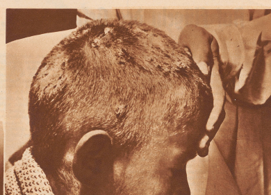
Aufnahme vom 9. August 1932, vor der Behandlung: Zehnjähriger in Polen geborener Knabe, der im ersten Lebensjahr an Erbgrind erkrankt, an dem auch seine Mutter litt.