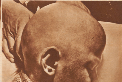
Aufnahme vom 28. November 1932: Erfolg der Einwirkungs-Behandlung, die am 6. Oktober in einer einmaligen Sitzung von fünf verschiedenen Seiten ausgeführt wurde. Glatzhaare Haarzettel, bewirkt durch die Röntgenstrahlen.