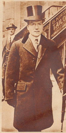
J. D. Rockefeller der Jüngere, juristisch alleiniger Besitzer des riesigen Familienvermögens.