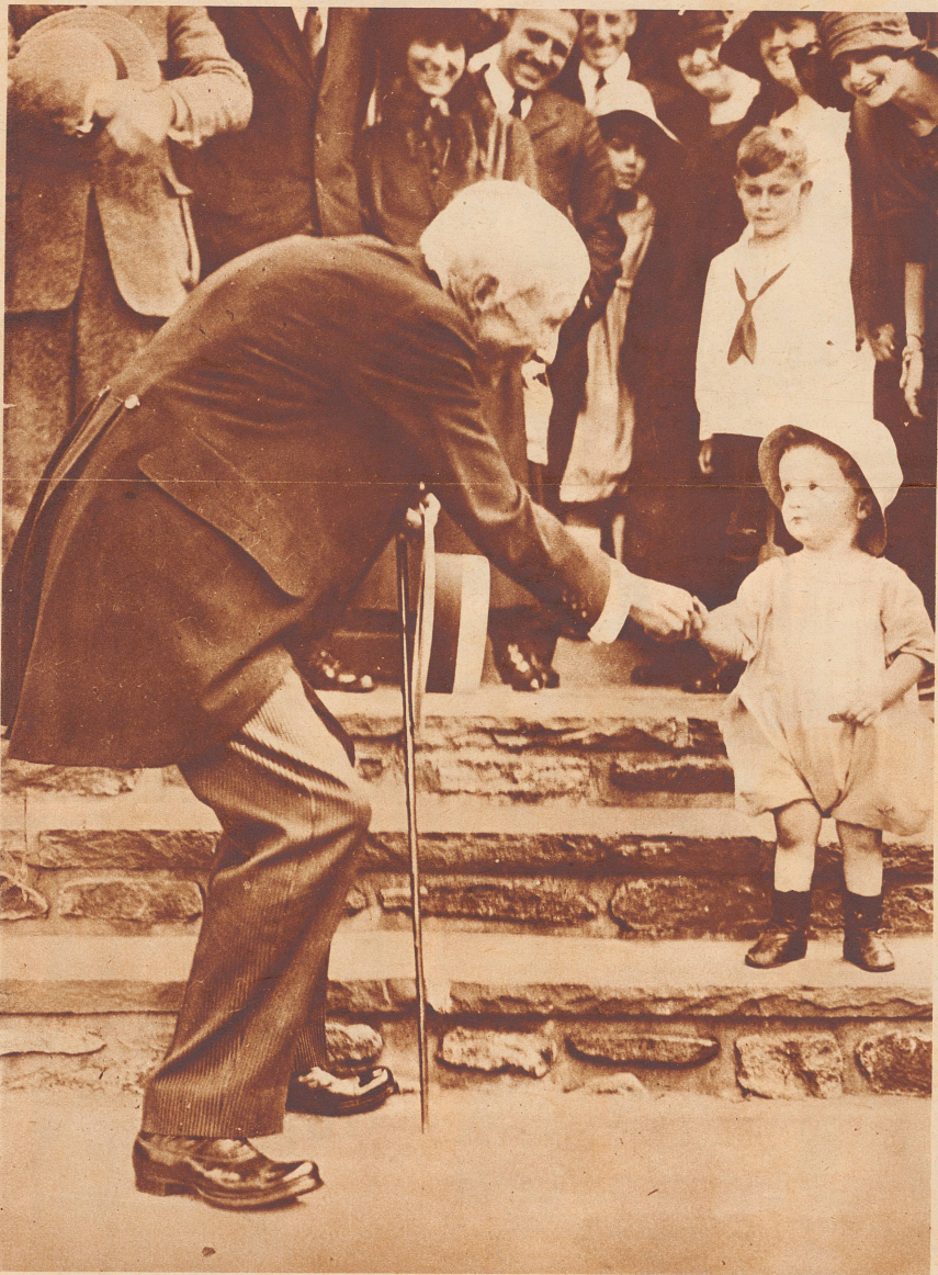
John D. Rockefeller in seiner charakteristischen Geste; er schenkt einem Knirps das legendär gewordene Nickelstück. Rockefeller hat, was schenken anbelangt, seine eigenen Maximen. Er ist fürs Sparen und fürs organisierte Schenken, aber nicht fürs Ausgeben. Um seine «Erziehungsmission» großzügig ausüben zu können, verschaffte er sich einmal 20 000 dieser kleinen Münzen, die er an 20 000 junge Leute verteilte. Jedesmal gab er seinen Lehrspruch von der Sparsamkeit mit.

John D. Rockefeller. Man sah in ihm entweder einen bluttriefenden Ausbeuter oder einen Heiligen. Die Arbeitskämpfe, die in seinen Unternehmungen Todesopfer gefordert haben, machten ihn in den weitesten fortschrittlichen Kreisen verhaßt wie kaum einen zweiten. Allmählich aber drangen auch andere Nachrichten über ihn in die Öffentlichkeit. Man erfuhr, daß er auch auf einem anderen Gebiete, und zwar auf dem Gebiete der organisierten Philanthropie Unerhörtes geleistet hat. Der Mann, der grundsätzlich nicht mehr als 10 Cent einem Bettler gibt, gab 750 Millionen Dollar für die Bekämpfung von Volkskrankheiten in außeramerikanischen Ländern, für die Verbesserung der Unterrichtsmethoden in allen Ländern der Welt, für die Gründung von Universitäten und Lehrstühlen zwecks Förderung der exakten Wissenschaften und für unzählige andere, eindeutig begrüßenswerte Zwecke.