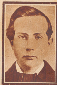
John D. Rockefeller 18 Jahre alt. Er hatte zu dieser Zeit eine Stelle inne als Magazinverwalter und Buchhalter und verdiente 25 Dollar im Monat.

Kein Mensch war in Amerika mehr umstritten als