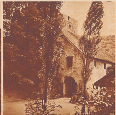
Im Schloßhof selbst wurden fröhliche Silberrappeln, und die Tür steht gastfreundlich geöffnet.