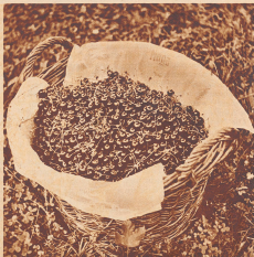
Tausende solcher schöner Kornähren mühen in diesen Wochen Abnehmer finden. Wird strom bei dem Blick des Kornes nicht zum Vergleichen?