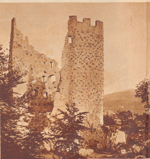
Hochgetürmte, heute noch dekoriert, ist die Ruine Pfefflingen des Schloßberg. Hier stand einst die große Burg in der Umgebung von Basel.