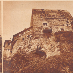
Umklübt und überwacht nicht auch die Schloß Angenstein von unten aus.