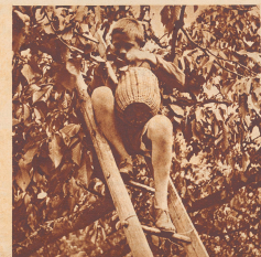
Im Basbiet beruht in diesen Tagen ein einiges Trüben, denn jung und alt muß mitarbeiten, den reifen Kornähren zu bergen.