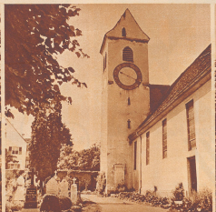
Harmonisch im Landschaftsbild eingepaßt, von ihrem kleinen Friedhof umgeben, steht die 1322 erbaute S. Marienkirche mitten im Dorf Pfefflingen.