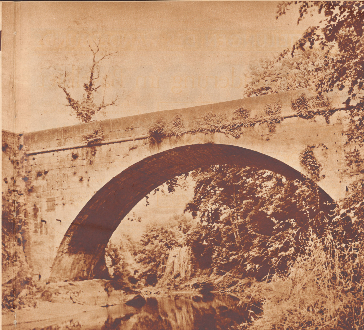
Wer würde glauben, daß diese Märchenlandschaft keine 20 Meter von der breiten Amorette Aesch-Grellingen entfernt liegt!

Von hier e. w. d. r. zurück auf der Straße gegen das Dorf. L. der ehemalige Friedhof (1606) (HB) der Familie von Blarer (HB), die der Kirche, dem Saale und der Arme viele ausgestrichene Männer geliefert hat. Zur Tramstation der Linie 11. — O. d. r. dem rechten Birsufer entlang zur Bahnhofsstation Aesch, 302 m. 19 o Süd.