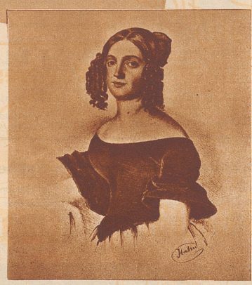
Charlotte Birch-Pfeiffer Leiterin des Zürcher Stadttheaters von 1837–1843.