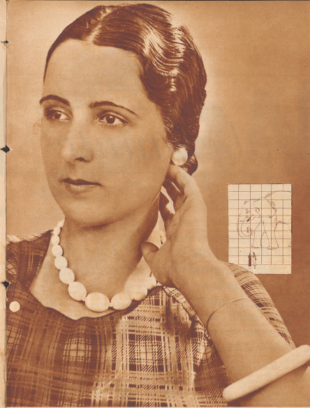
Man trägt - auch wieder den schicksten Elfenbeinbesatz.

Schleife und Tasche Modell Duxler-Giraffe. Das Elefantenband wurde uns von der Firma Heber & Amsharov freundschaftlich zur Verfügung gestellt.