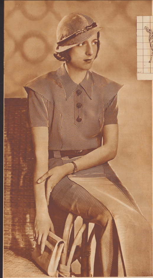
Man trägt - in diesem Sommer jugendliche Kleider aus dunkelgrüner Seide.