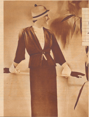
Man trägt - für den Verzicht das schwarze Tüllcor mit der weißen Seidenbluse.