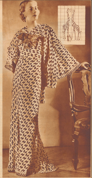
Man trägt - hellgrünige Abendkleider mit dunkler Musterung.