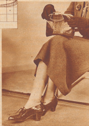
Man trägt - zum Strahlenkleid Schuhe aus Krokodillleder und die dazu harmonisierende Tasche.