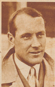
Hans von Stuck, der berühmte Rennfahrer und Verfasser des Kinderbuches: «Peters großer Preis».