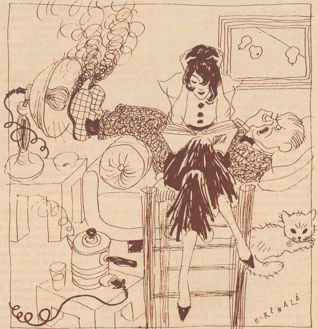
«Paß doch auf, Päuly, du läßt ja schon wieder das Essen anbrennen —!»

«Ich las kürzlich in der Zeitung, daß man in einem alten ägyptischen Tempel Drähte gefunden hat, die zu beweisen scheinen, daß die alten Ägypter schon eine Art Telefon hatten.» «Das ist ja möglich, aber die alten Assyrer waren doch schon viel weiter! Bei Ausgrabungen in Babylon hat man keine Drähte gefunden, und das ist doch der sicherste Beweis dafür, daß man dort schon drahtlos miteinander verkehrte.»