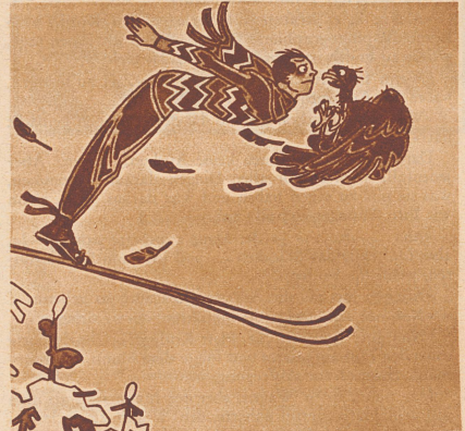
Schreckliches Abenteuer eines Sprungrekordmannes im Gebirge.

Astronomie. Zwei Freunde diskutieren spät abends auf dem Heimweg vom neuen Wein über den Mond. «Auf dem Mond muß es ja schrecklich sein. Keine Bäume, kein Wasser, keine Menschen, überhaupt nichts. Ich möchte nur wissen, wozu der eigentlich da ist.» «Das sag ich auch. Aber wo soll er hin?»