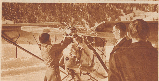
Am 2. Februar wurde in Anwesenheit eines Regierungsvertreters, der Gemeindebehörden und der Kurdirektoren von Arosa und Davos das Flugzeug feierlich getauft. An der Propellennabe zerschellt knallend die traditionelle Champagnerflasche.

Spazierflüge über Arosa. Arosa hat als erster Kurort der Schweiz ein eigenes Flugzeug in den Dienst seines Fremdenverkehrs gestellt. Es ist eine englische Leopard-Moth-Maschine, ein wendiger, schlanker, einmotoriger Hochdecker, der Raum bietet für zwei Fluggäste. Ende letzter Woche ist der Apparat vom Piloten Robert Fretz aus England nach Arosa übergeführt worden und ist jetzt auf dem zugefrorenen Obersee stationiert, von wo aus täglich Passagierflüge ausgeführt werden. Zur Sommerzeit, wenn keine Eisdecke auf dem See als Startplatz dienen kann, wird das flinke Flugzeug in Dübendorf stationiert sein und in den Taxiflugdienst eingesetzt werden. Bild: Das Flugzeug über Arosa, im Hintergrund das Furkhorn.