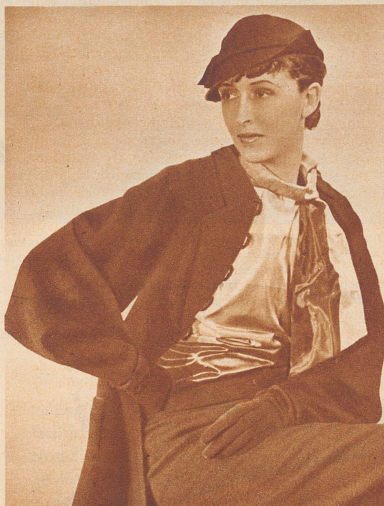
Nachmittagskostüm aus schwarzer Wolle mit buntgestreifter Taffetbluse und zweifarbigem Echarpé, das seitlich leicht geknotet ist. — Modell: Mainbocher.