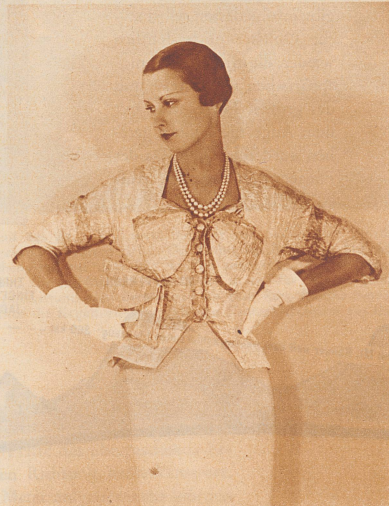
Lichtblaues Abendjäckchen mit halblangem Aermel und passender Abendtasche. Der Schnitt des Jäckchens wird formal durch die große Schleife wiederholt. — Modell: Mainbocher.