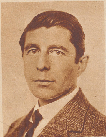
† Knud Rasmussen der bekannte dänische Polarforscher und Ethnologe, starb 54 Jahre alt in Kopenhagen.