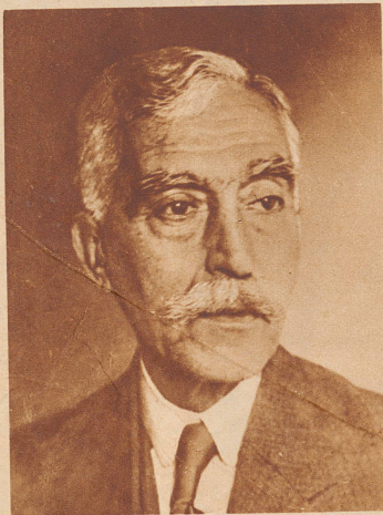
† Oberst Francisco Macia der Präsident der autonomen spanischen Provinz Katalonien, starb 74 Jahre alt.