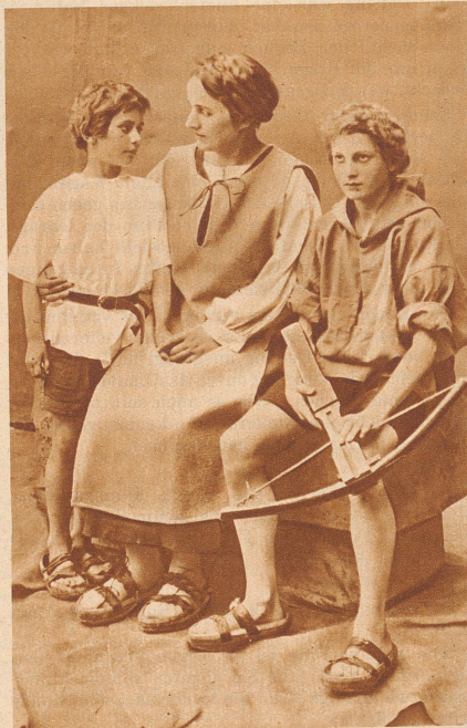
Tellspiele in Altdorf

Da war wieder ihr entzückendes, zwangloses Lachen. Was hielt ihn ab von dem zarten Versuch