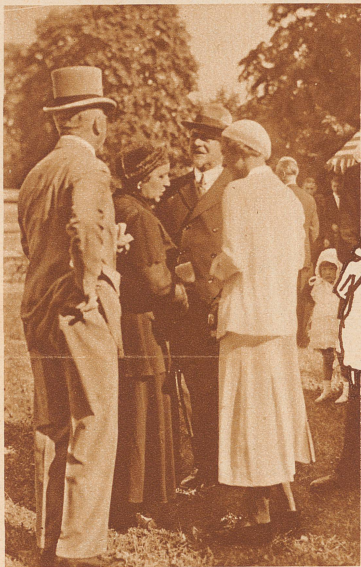
Hohe fremde Gäste auf dem Rennplatz: Der Prinzgemahl von Holland (Mitte) im Gespräch mit Freiherrn von Holzling-Berstett (Deutschland)