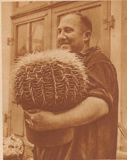
Der Kakteenpfleger mit seinem stacheligen Schützling

Endlich gegen Mittag sieht sie aus einem Taxi einen Mann ohne Hut steigen . . . , er zahlt eilig und tritt in das Haus. Es ist Monsieur Terniers Schritt, sie öffnet ihm. Er tritt ein, gebückt, beschmutzt, gealtert. Er macht ihr ein Zeichen zu schweigen. Sie