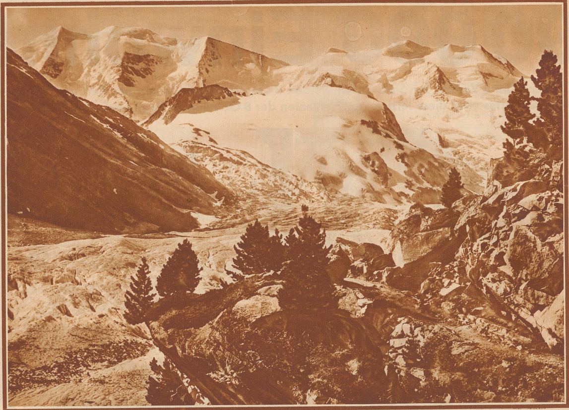
Die schönsten Berge im Kurgebiet von Pontresina. Blick auf Morteratschgletscher, Piz Palü und die Bellavistagruppe