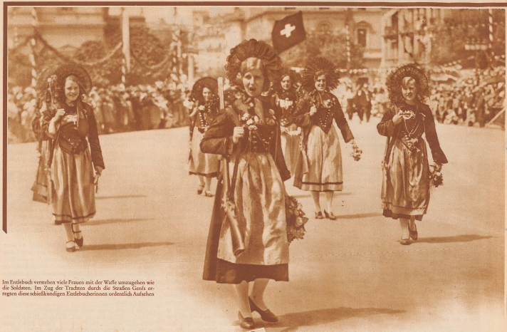
Im Entschloß verziehen viele Frauen mit der Waffe umzugehen wie die Soldaten. Im Zug der Trachten durch die Straßen Genévs erregten diese schicklich verzierten Entschloßerinnen ordentlich Aufsehen