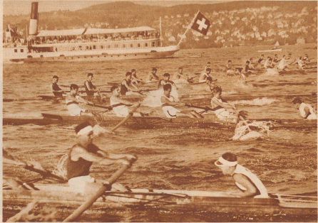
Internationale Ruderregatta in Zürich, 27. 28. Juni 1931 Start der Gäste-Vierer mit Steuermann, in welcher Kategorie die Société Nautique »Étoile« Bild Sieger blieb