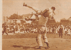
Nordostschweiz. Schwingfest in Amriswil. Fyrmann und Plücker im heiligen Kampf beim Ausschwingen von Ring