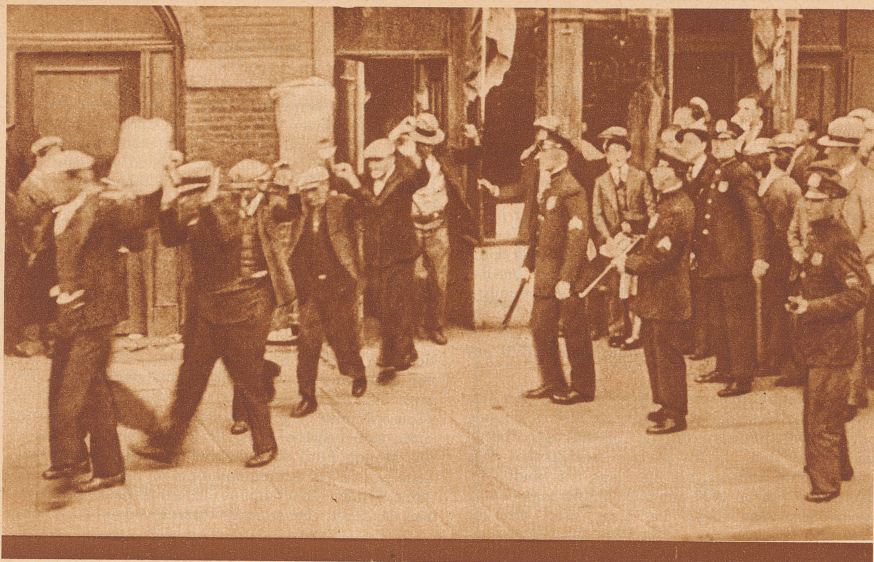
Razzia in Chicago. Die Polizei hat in ein Speakeasy oder eine Alkoholbrennerei eine Streife unternommen und führt sämtliche erappten bootlegger mit erhobenen Händen ab. Die Sache ist nicht so ernst wie sie aussieht; wahrscheinlich werden die meisten, wenn sie einigermaßen von Bedeutung sind, am nächsten Tage wieder freigelassen

wagen! Man muß an den Ausspruch des alten Patrick Roch, eines staatlichen Untersuchungsbeamten, denken: