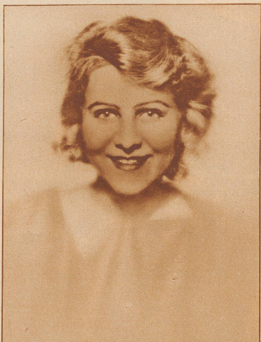
E. Biber, Berlin

Benützen Sie in Ihrem eigenen Interesse für Ihre Insertionen die Zürcher Illustrierte