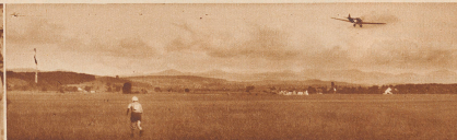
Das Flugzeug hat die Staffette über dem Flugplatz Dübendorf abgeworfen. Der zur Equipe gehörige Radfahrer läuft nach der Abwurfzeit. Die Staffette selber hat, wie wir im Bild sehen, den Boden noch nicht erreicht.