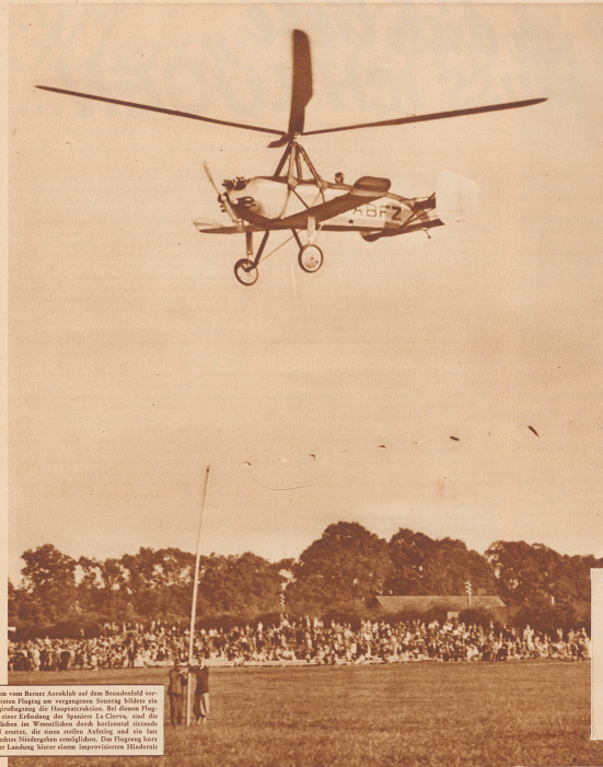
Bei dem vom Berner Aeroklub auf dem Bundesfeld veranstalteten Flugtag am vergangenen Sonntag bildete die Ausprobierung der Flugapparate. Bei diesem Flugtag, einer Leistung des Spanier La Cueva, sind die Flugzeuge im Wettbewerb durch horizontalen Fluchtflug ersetzt, da man stellen möchte und sich fast unbewusst Notwendigkeit ergibt. Die Flugzeuge kamen vor der Landung durch einen improvisierten Hindernislauf.