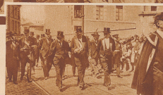
Aus den Beisetzungsfestlichkeiten der ersten 77 Todesopfer des Schiffbruchs des «St. Philbert» in Nantes nahm auch Britand teil.