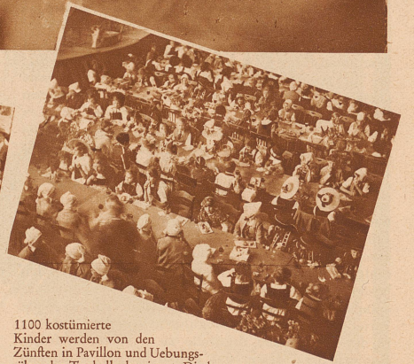
1100 kostümierte Kinder werden von den Zünften in Pavillon und Uebungssälen der Tonhalle bewirtet. Die bunte Gesellschaft gleicht von oben einer blumenübersäten Wiese