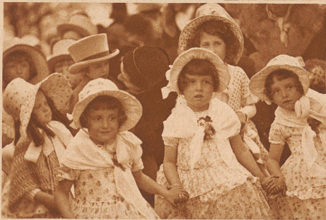
Das Publikum kann sich an zierlichen Biedermeierlis nicht genug satt sehen