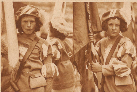
Zwei stramme Fährliche aus der Fahngruppe der 22 Kantone