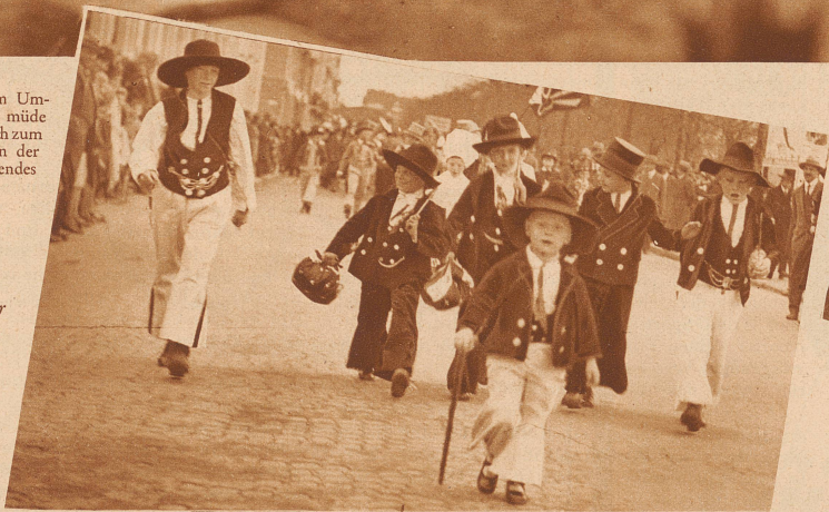
Der Kinderumzug liefert jedes Jahr frischen Nachwuchs an Hamburger Zimmerleuten