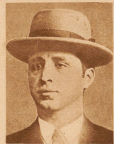
Rechts: Die beiden Hauptattentäter.